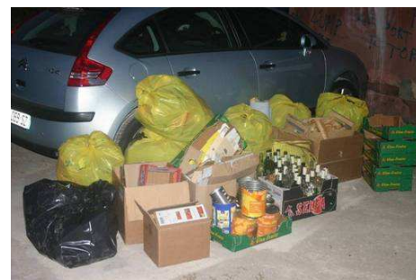
Exemple de tri en sacs sur le Festival Etang d'Arts de Saint-Chamas