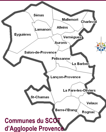
Communes du SCOT d'Agglopoles Provence