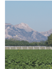
« Art de Vivre et Dynamisme »